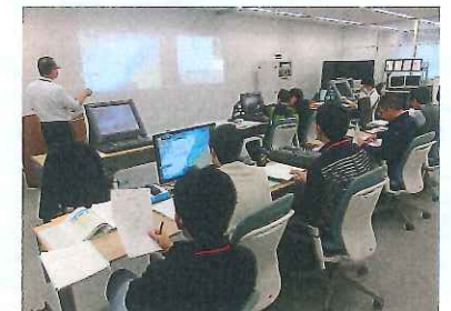
ECDIS シミュレータ訓練