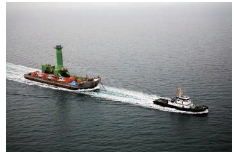
大型プラントの曳航