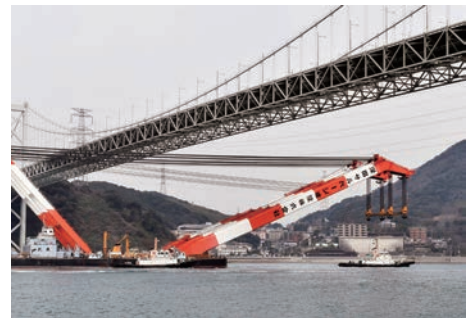
大型起重機船の曳航

理事会は毎年、新年と決算報告を兼ねて4月前後に開催する他、適宜必要に応じて開かれている。また、毎年5月に泊まりがけで開催される総会には、例年80人前後の組合員が参集しているが、これに参加出来ない組合員のため大阪、中国、関東、九州の4地区で、国土交通省から担当者を講師に招いて「内航海運の現況と今後のあり方」などについて研修会を開催し、意見交換と親睦を図っている。