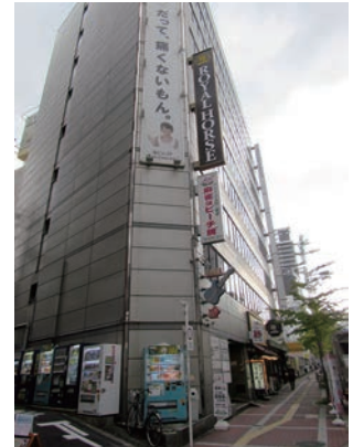
事務局のあるミュキビル