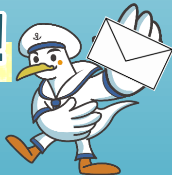
船員保険イメージキャラクター かもめっせ