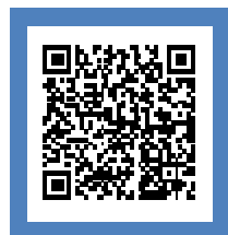
「船員の健康づくり宣言」エントリー船舶所有者様の一覧掲載ページ